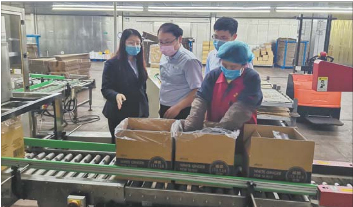
到泰丰食品调研走访了解企业经营情况及资金需求。

根据生态环境部发布的《环境影响评价公众参与办法》(部令 第4号)相关要求,对本项目建设情况及环境影响评价进行公示,以便广泛了解社会各界公众对本项目的态度及环保方面的意见和建议,接受公众的监督。