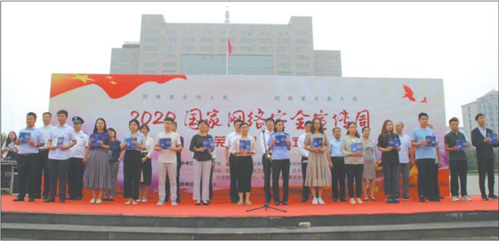
活动现场,为市民代表发放了宣传资料。

本报9月17日讯(记者 亓玉飞) 为提高广大人民群众网络安全意识和防护技能的意识,近日莱芜区在莱芜大厦广场举行第七届全国网络安全宣传周启动仪式,区直有关单位分管负责人,各功能区、镇(街)分管负责人,互联网企业及群众代表共计160余人参加仪式。 活动现场,为市民代表发放了宣传资料,参会人员依次在活动背景板上进行了签名。此次网络安全宣传周以“网络