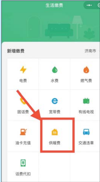
第三步: 选择点击“供暖费”