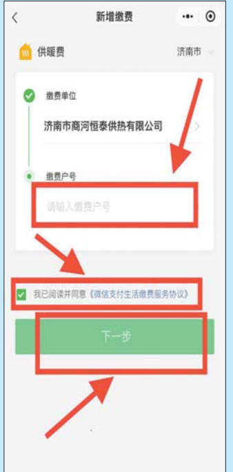
第五步: 填写“缴费卡号”