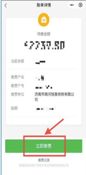
第六步: 核对信息无误后进行缴费