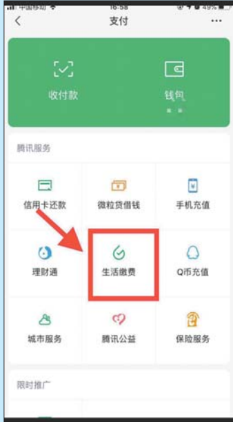
第二步: 选择点击“生活缴费”