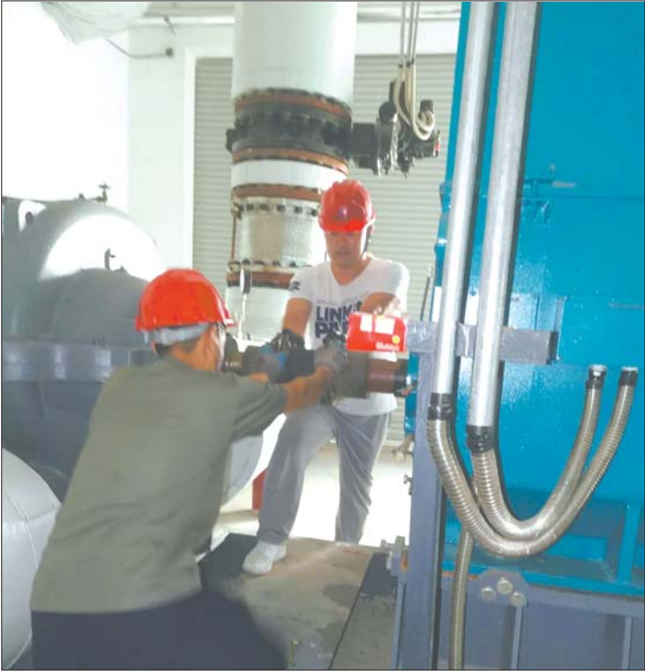
锅炉班组工作人员正在检修。

为更好地提升服务质量,解决供暖用户用暖问题,根据济南能源集团下发的《2020年“质量月”活动方案》、济南热力集团有限公司下发的《济南热力集团有限公司2020年“质量月”活动方案》要求,济南市商河恒泰供热有限公司积极开展“质量月”活动,全面提升服务质量,做好供暖管家。