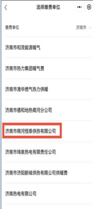
第四步: 选择点击“济南市商河恒泰供热有限公司”