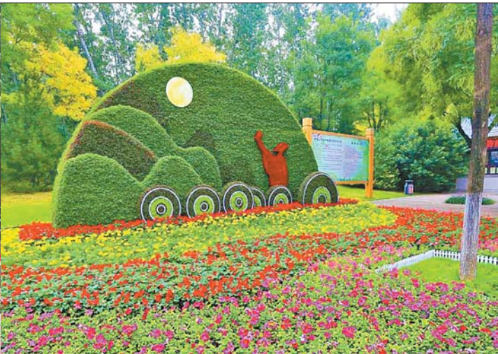
街头各种造型的花卉组合让泉城变成花园城市。