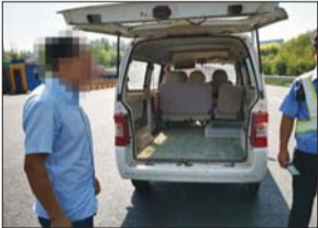
驾驶人私自拆除面包车座椅,将其当做“小货车”使用。

小超市,把面包车后排座位拆掉,只是为了拉货方便。随后,民警详细地向驾驶人讲解了擅自改变机动车参数的危害性,并依法进行处罚。