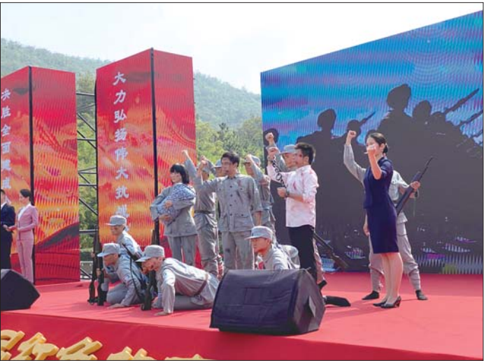
大赛启动仪式现场演员精彩表演。

广播电视台等部门共同举办“红动齐鲁”山东省第二届红色故事讲解大赛。9月26日上午,大赛启动仪式举行,主会场设在泰安,五个分会场设在德州、淄博、临沂、威海、东营。