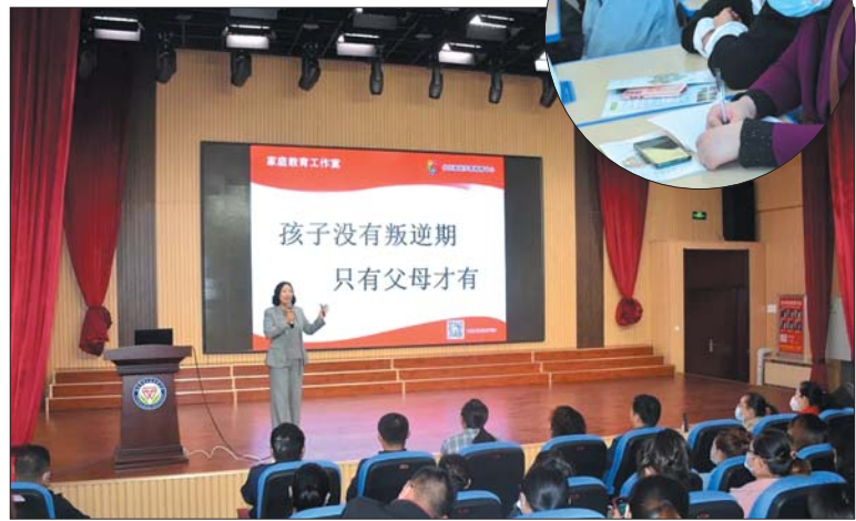
“家校共育,携手同行”家庭教育巡回宣讲活动现场。

此次系列活动的举办,为推动构建家庭教育新生态,在新时代发展家庭教育起到了重要作用,全体教师和家长将以此次活动为契机,进一步加强家校联系,携手为学生“扣好人生的第一粒扣子”。