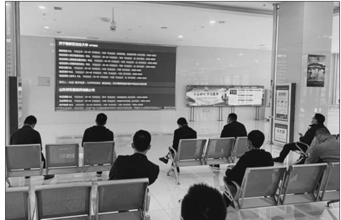
市人才市场每天及时发布企业招聘信息。