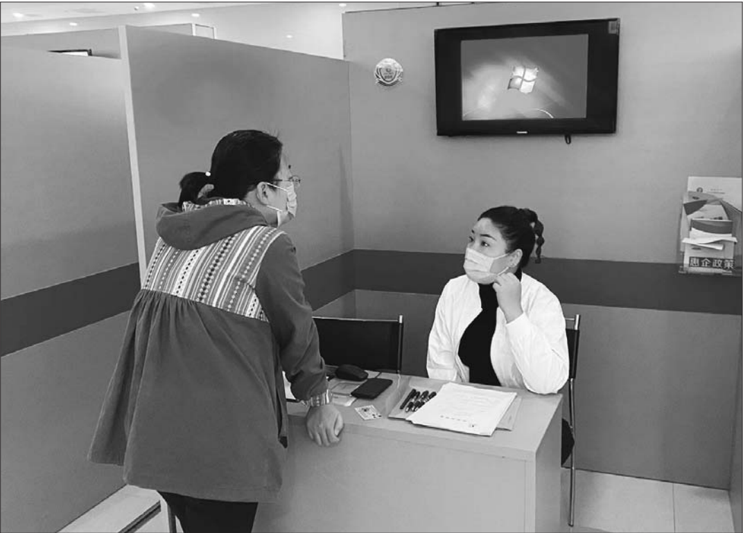
一位求职者在招聘会上与用人单位洽谈。