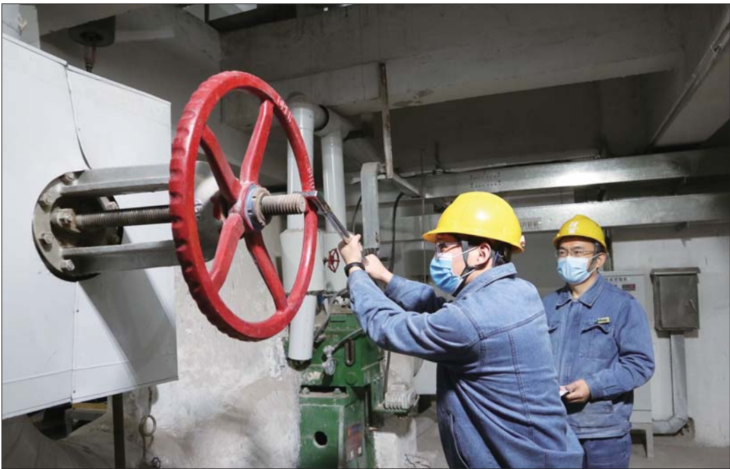
华能嘉祥电厂工作人员提前做好供热调试等前期准备工作。