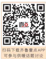
扫码下载齐鲁壹点APP 可参与供暖话题讨论

供暖季即将来临,齐鲁晚报·齐鲁壹点特别开启“壹点问暖”栏目,接受市民反映咨询供暖相关问题。扫描下方二维码下载齐鲁壹点客户端,@记者反映供暖问题即可。我们将把你的问题反馈给热企或主管部门,协调推进解决问题。