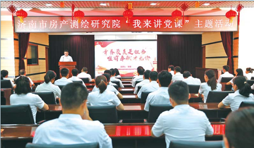
济南房测院青年党员、山东省道德模范张辉参加全市“我来讲党课”主题活动。