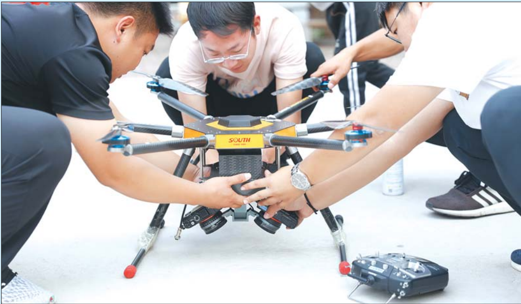
济南房测院工作人员调试无人机设备,在南部山区采集村域地理信息数据,助力美丽乡村建设。

融入精神文明创建全过程。以“不忘本来,吸收外来、立足当下、面向未来”为总基调,打造济南房测奋斗文化体系,将社会主义核心价值观深度融入单位文化实践,推出全新文化手册和标志系统。召开企业文化专题培训会,为单位发展提供强有力的文化支撑。