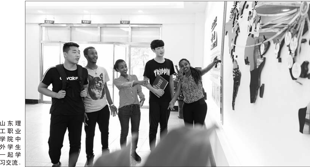
山东理工职业学院中外学生一起学习交流。

本报济宁11月19日讯(记者 姬生辉 通讯员 周小龙) 14日,由中国高等教育学会等主办的亚洲高等教育论坛年会在成都举行。来自30多个国家和地区的800余位教育专家围绕后疫情时代的教育发展交流经验、探讨学术。期间,发布了“2020亚太职业院校影响力50强”榜单,山东理工职业学院名列其中。这也是该院第二次获此殊荣。 亚洲高等教育论坛主要发起者为菲律宾前总理拉莫斯、韩国前总理李寿成、玻利维亚前总统豪尔赫·基罗加等亚太地区政要。自2003年论坛发起迄今,已成功举办了包括发起者会议在内的十六届年度国际盛会,日益成为亚洲区域内各国政要、专家学者、院校、国际组织间交流与