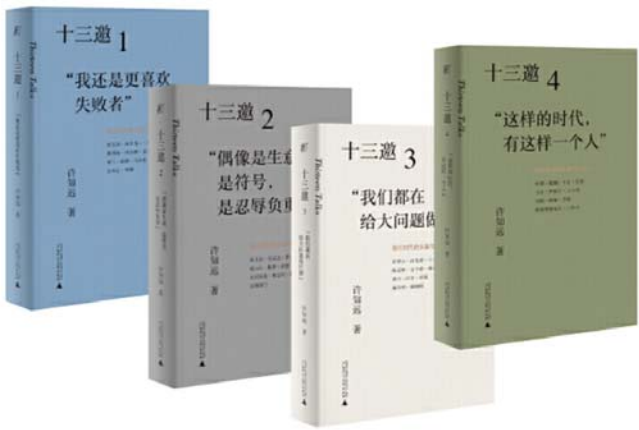
《十三邀：我们时代的头脑与心灵》(全四辑) 许知远 著 广西师范大学出版社

他们大多是各自领域的杰出人物——小说家、哲学家、成功的商人、武术名家、导演、演员，令人不安的是，娱乐界占据着过大的比例，这不仅因为他们有丰富的故事可供讲述，也缘于他们可能带来的影响力，一个娱乐至死的年代。我多少期待借助这种影响力，对知识分子日渐边缘的趋势作出某种报复。 我和他们穿过三里屯街头，在桂林吃米粉，在无人的电影院里吞云吐雾，还在九龙的武馆里练习咏春拳……最初目的开始退隐，我越来越被探访过程吸引，我喜欢和他时而兴奋，时而不咸不淡的交谈，一些时候甚至陷入不无窘迫的沉默。沉默，与言说同样趣味盎然。 这个尝试比原想的更富诱惑。不管多么自以为是，你都不能通过几个小时的相处，就声称理解另一个人。但谈话自有其逻辑，它逼迫双方勾勒自己轮廓，探视自己的内心。在陌生人面前，人们似乎更易袒露自己。 镜头令我不安，它充满入侵性，尤其在人群中，我尤为不适。我也害怕屏幕上的自己，远离后期制作，也从未看过一期节目，心中亦多少认定，这并非是我的作品。但我对影像产生了新的兴趣，那些无心之语、一点点尴尬、偶尔的神采飞扬，背后的墙壁上的花纹，皆被记录下来，它提供了另一种文本。比起写作，它也是一种更即兴的表达，带来意外的碰撞与欣喜。 我意识到，它逐渐成为我生活的一部分。镜头也没那么讨厌了，它给交谈带来正式感，令彼此的表达更富逻辑与结构。也借助镜头，我的经验范围陡然增加，一些时候，甚至是梦幻的。是的，哈贝马斯与贝鲁奇尚未见到，但我的确与坂本龙一在纽约街头闲逛，在东京与黑木瞳喝了杯酒，与陈冲在旧金山海边公园的长椅上闲坐。