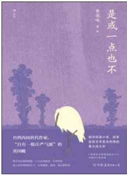
《是或一点也不同》 黄国峻 著 中国友谊出版公司

书中共收录四个故事，它们发生在遥远的宇宙和不明的时代，充满幻想色彩又和我们的世界若即若离。名为“南十字星”的星球贯穿全书，它是星际漫游客，收藏宇宙间的各种奇观。当世界失序，人群惶恐，小说中的四个主角却孤独而平静，他们选择仰望星空，与南十字星分享只有他们才懂的秘密。