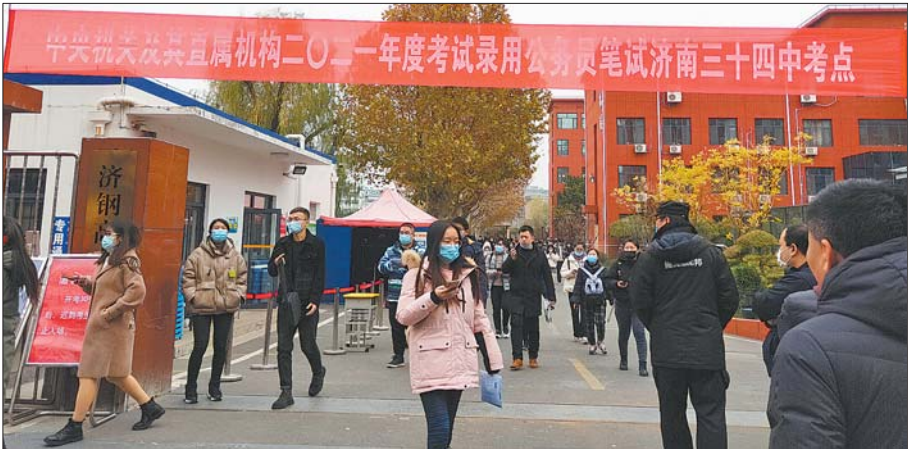
11月29日,2021年国家公务员考试公共科目笔试举行。

11月29日,2021年国家公务员考试公共科目笔试举行。中央机关及其直属机构79个部门、23个直属机构计划招录2.57万人,招录规模为近三年之最,有157.6万人此前通过了报名资格审查。山东共招考1292人,部分岗位“千里挑一”。在今年国考公共科目笔试中,行测题型较往年一脉相承,申论题型则“稳中有变”。