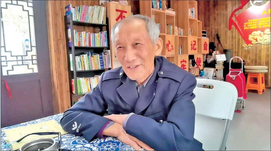
老人身上的衣服是退休前发的,已经穿了至少16年。