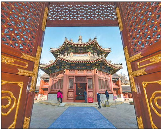
这是12月1日拍摄的陈列马首铜像的圆明园正觉寺文殊亭。

国家文物局局长刘玉珠说,马首归园,昭示文物追索新方向。同时,马首归来,已不再是一件皇家私藏,而是属于全体人民的文化遗产。刘玉珠表示,归来不是终点,如何做好文物利用下半篇文章,发挥其独特作用,丰富公众文化生活,才刚刚破题。圆明园是首批国家考古遗址公园,全国爱国主义教育示范基地,他期待圆明园讲好马首回归的“中国故事”。