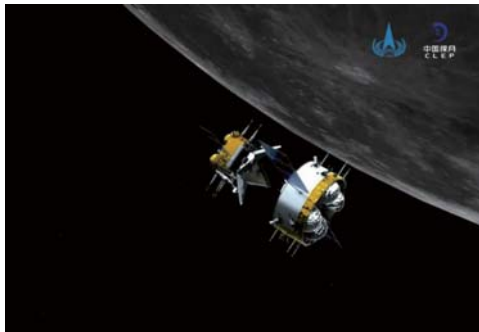
轨返组合体与上升器分离后模拟图