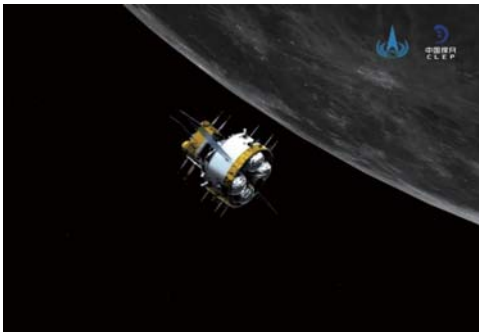
轨返组合体与上升器分离前模拟图