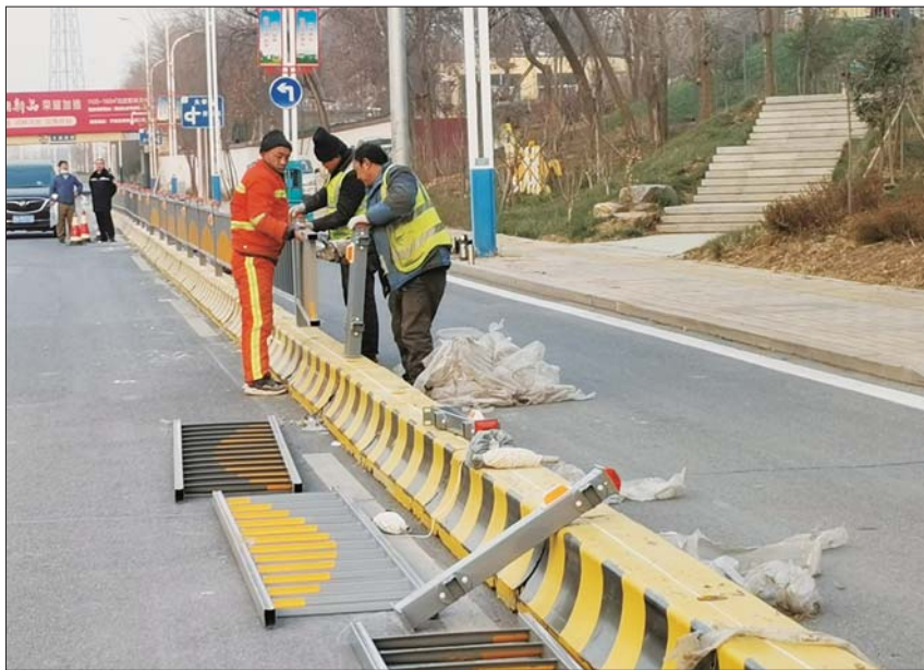
工作人员在为改单行道做最后工作。

作为一条综合性的道路，岔河东西大道横贯德州市主城区的南北区域，南起于官屯大桥，北至北外环高架桥，途经新河路、东风路、东方红路、三八路、天衢路、大学路等主要交通干道。近几年，通行效率不断降低，与沿途配套建设和住宅区逐步完善不无关系。 据2018年4月4日德州市规划局网站发布的《岔河两侧外堤整体改造建设工程设计规划公告》显示，德州市规划在南起南外环，北至北外环，包含岔河两岸外堤及堤顶路，进行岔河两侧外堤整体改造建设工程，总面积136.8万平方米。改造后，该区域将打造成为德州最自然健康的城市绿道，最具魅力的植物科普廊道。经过两年的建设，该工程目前多数路段已对外开放，供市民游玩健身。 公园不断完善，住宅区建设更是频频发力。7月29日，据公开资料显示，德城区原德州振华玻璃厂地块于德州市公共资源交易中心公开拍卖四宗土地成交，均为居住商服用地，而该路段正是位于岔河大道沿岸。目前，项目已经开工建设。 上述例子只是该路段沿途建设发展的一个掠影，扩建仍在不断进行。 记者搜索百度地图发现，经由岔河东西大道沿岸，目前仅显示的在建或已