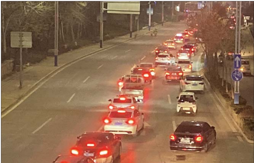
下班高峰期岔河大道拥堵严重。

23日下午，记者在岔河西大道发现，道路中间树立多个“前方施工”的警示牌，道路中间的实线已经改为虚线，人行横道标线清晰可见，工人们正在安装分隔护栏。 “这是单行道相关配套设施建设，目的是在没有特定的非机动车道路段，将其与机动车隔离开来，为实行单向通行做准备，两岸所有的护栏大约在3公里左右，目前工程已经接近尾声。”现场一名工作人员表示。 在投票期间，据交警部门发布的解答介绍，岔河西大道、岔河东大道对分流市区交通流量，缓解区域交通压力发挥了积极作用。随着时间的推移，两条道路吸引的交通流越来越多，双向交通中左转、直行机动车冲突点较多，而各立交桥两侧匝道距离太近，无法通过建设交通信号灯控制冲突点，交通拥堵已经成为常态，部分人大代表、政协委员及广大市民对调整单行线的呼声越来越高，公安交警部门经反复征求社会各界意见，并邀请山东正衡交通工程研究院论证设计，决定对岔河东大道、岔河西大道实行单行交通组织。 交通组织的优点主要有：一是减少各匝道、平交路口冲突点，实行右进右出，有效提高车辆行驶速度，可使岔河东、西大道发挥中心城区南北快速通道的作用，符合立交分流的设计初衷，提高安全保障水平。 同时，公布的解答显示，针对部分市民建议单行交通组织分路段、分时段实施，大学路以北、新河路以南部分路段维持双向通行，或者高峰期实施单行。在前期调研论证过程中，分段实施列为方案之一考虑，但基于岔河东、西大道与相交道路多为立体交叉起止点，不宜通过设置信号灯或强制隔离设施分流对向车流，仅通过标志标线控制存在较大安全隐患；单行路线较长，路段内交叉口较多，分时段实施难以统一控制起止时间；只对机动车实施单向通行，非机动车与行人均维持双向通行坚持“慢行优先”原则等原因，最终确定全路段实施单行交通组织。