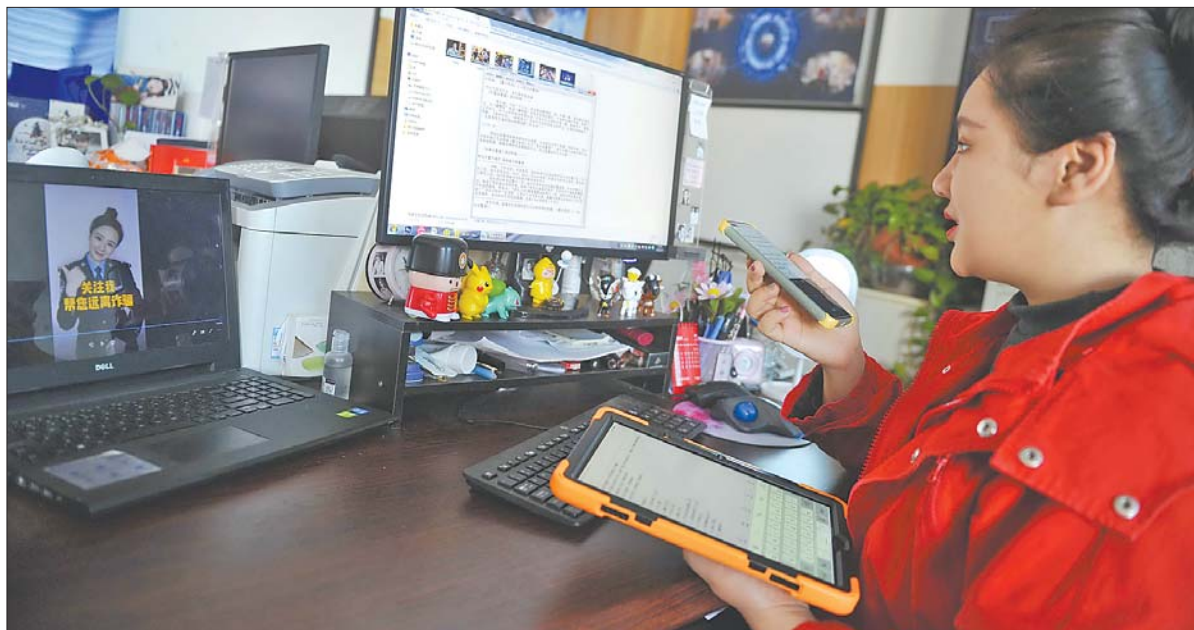
天慈正在写拍摄视频的文案和脚本。