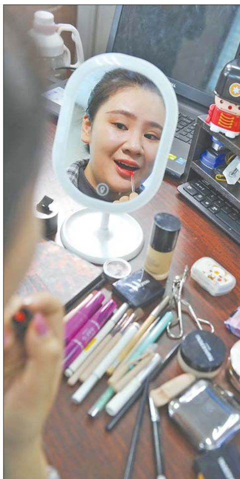
▲天慈准备化妆拍摄短视频。