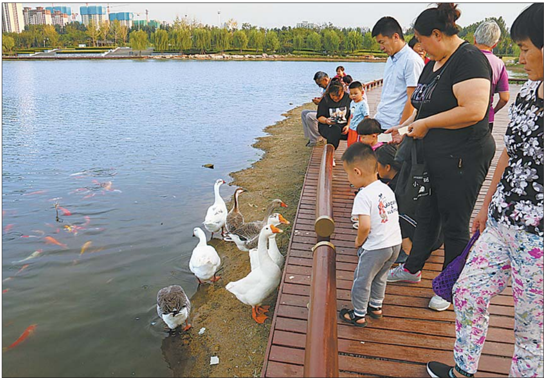
这个特殊的大家庭吸引了众多市民前来“做客”。

了个名字“慧慧”。慧慧是一只雌雁。为了让它享受天伦之乐,去年初夏,人们寻来了几个鹅蛋让它孵化,可惜它坐了好多天的“月子”,却没能孵出一个宝宝来。后来,有人特意从外地买来了两只雁鹅与它为伍,可惜买来的两只雁鹅也是雌性,彼此之间只有做闺蜜的缘分。再后来,又有人送来了4只当地饲养的不同性别的白鹅与其作伴,使慧慧与雁鹅、白鹅组成了如今的七口之家。有了哥哥姐姐的带领和佑护,慧慧的胆子慢慢变大,生活更加安逸。它们在一起梳洗、游水、觅食。有时候,慧慧在水面上或疾速奔跑,或腾空起飞,在哥姐面前露一手绝招。随着邹城市生态园林环境的持续改善,近年来有多种禽类在当地或繁衍生息,或途经小憩。如今,杨下河已经被改造成了婀娜秀美的景观公园,观光休闲的人越来越多,因这只鸿雁而诞生的“特殊大家庭”,成了游客最喜爱的驻足点。