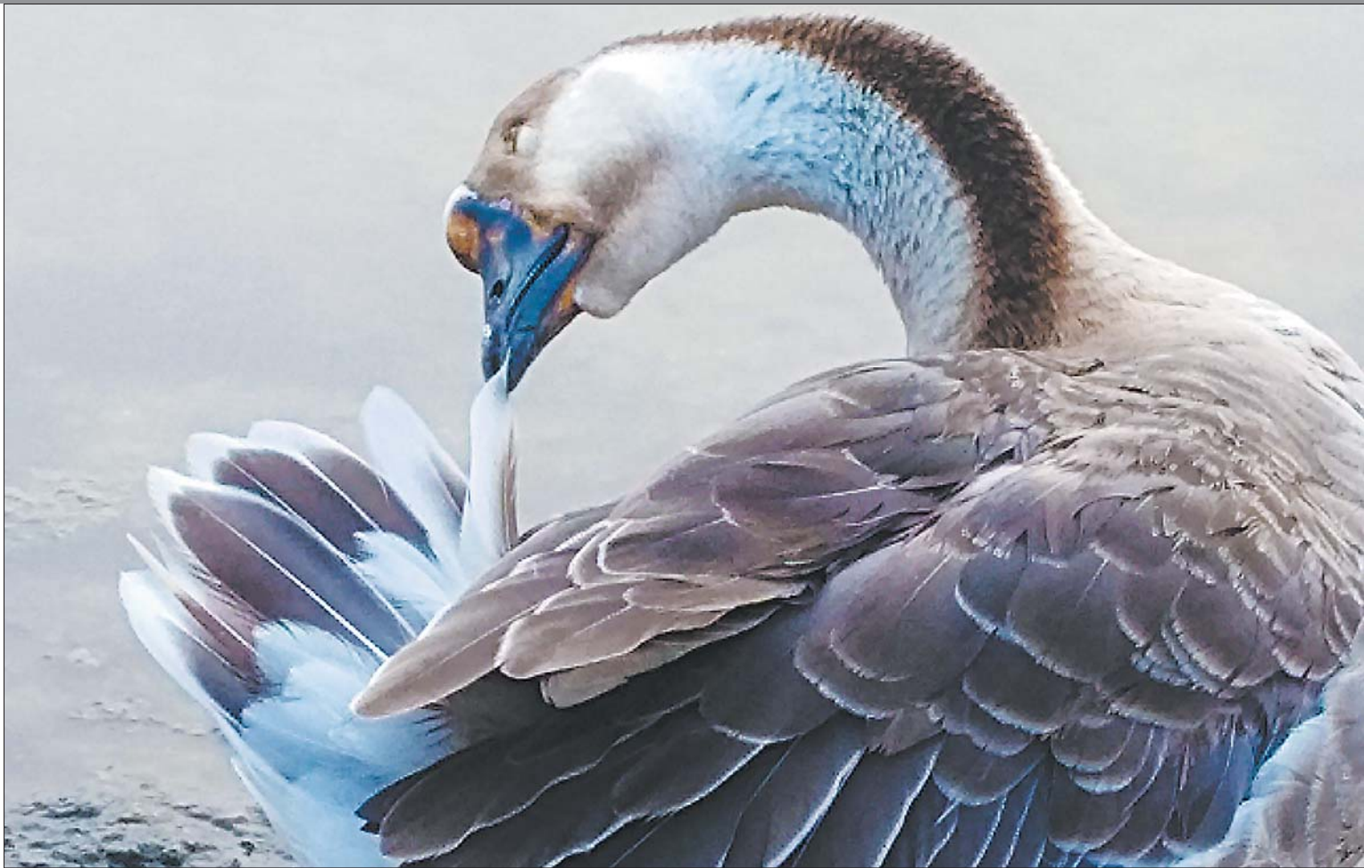
◀ 仔细 梳妆打扮的 慧慧。