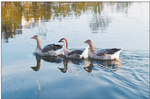
两只雁鹅一前一后,陪伴鸿雁在水中游弋。脖颈有灰白相间竖条状羽毛、黑色嘴巴的是鸿雁,全部灰色脖颈的是雁鹅。