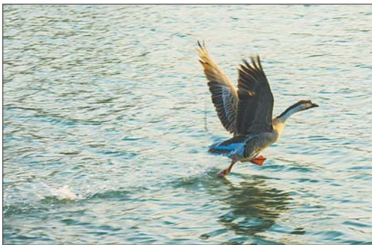
鸿雁时常露一手水上疾奔。