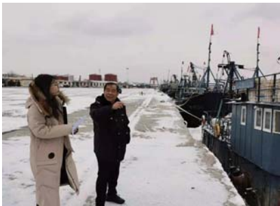
▲图为文登区检查组现场查看渔船在港情况。