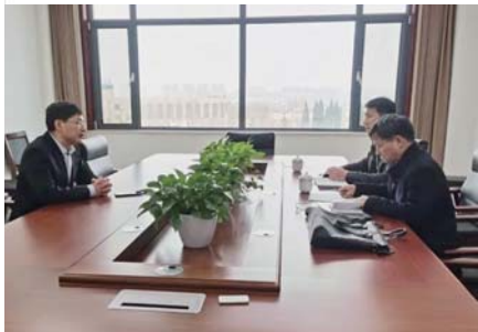
▲图为派驻第二纪检监察组到文登区公共资源交易中心对分管负责人进行谈话提醒。

为强化政府购买服务资金监管，近期文登区纪委监委各派驻纪检监察组对文登区机关事业单位政府购买服务资金管理自查自纠情况开展专项检查。