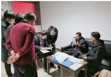
▲图为检查组到文登区镇街查阅会议记录、渔船包保信息等资料。

近日，文登区纪委监委联合区渔船管控工作专班，通过听取汇报、查阅资料、现场检查、电话抽查等形式进行督导检查，进一步压实镇街和有关部门落实渔船管控工作责任。