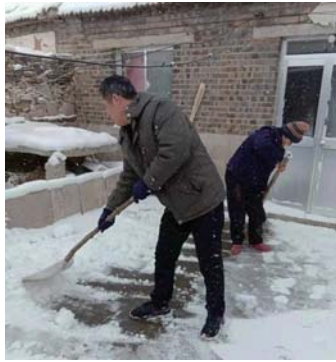
▲图为文登区泽库镇纪委为贫困户清雪。