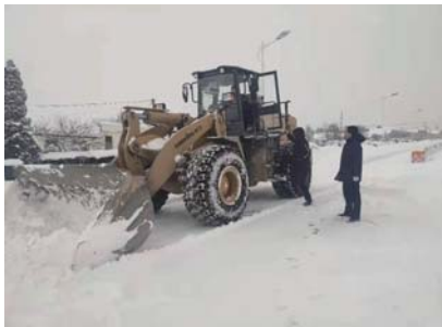
▲图为文登区张家产镇纪委镇督导清雪工作。

面对连日降雪，文登区各镇街纪委积极行动，通过清理积雪、督导扫雪、实地查看受灾项目、慰问困难老党员等行动，确保群众出行安全，提升群众幸福感。