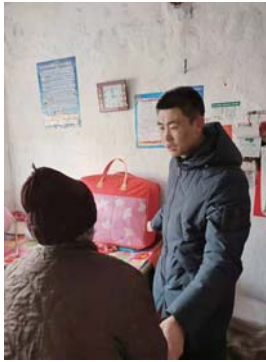
▲图为文登区文登营镇纪委到贫困户家中走访。

为保证群众温暖过冬，文登区各镇街纪委纷纷到困难群众家中走访，对过冬物资发放情况进行跟踪检查。