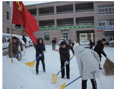
▲图为文登区金山纪委纪检监察干部参加清雪工作。