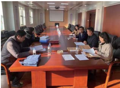
▲图为派驻第三、第四纪检监察组会同文登区财政局、审计局到文登区住建局监督检查。