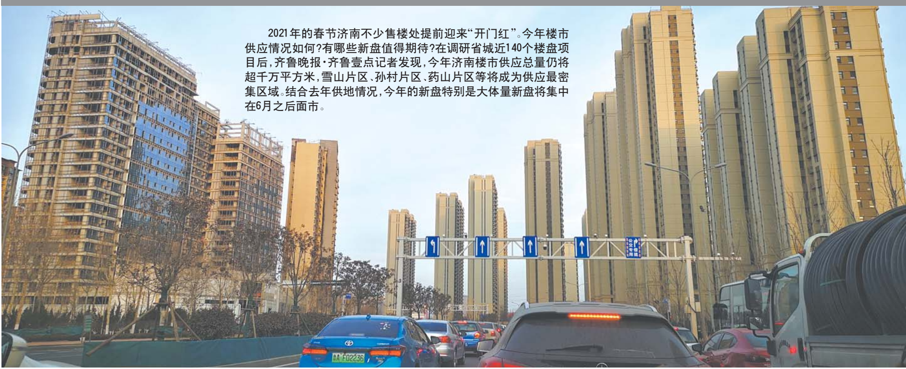
目前,济南东部的雪山片区已经高楼林立。