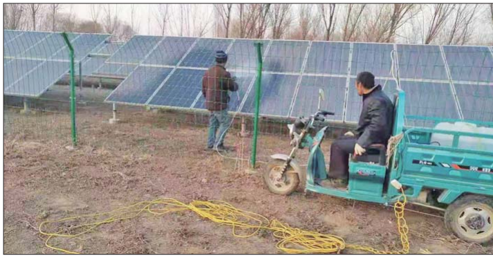
督促各村做好光伏面板清理维护。