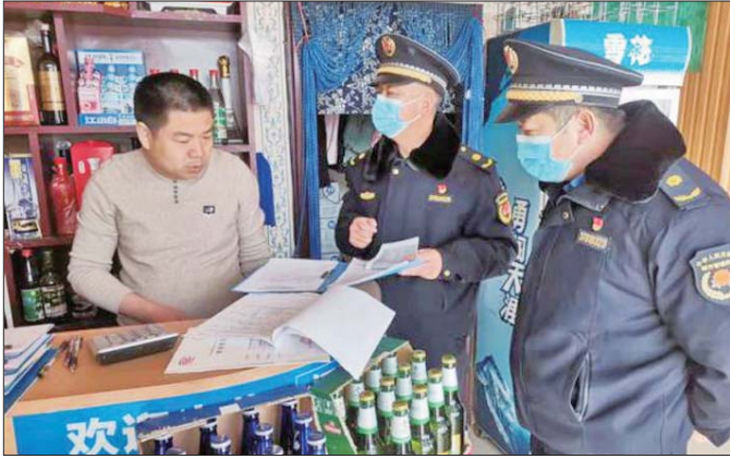
各中队人员耐心向商户讲解大气污染防治工作的基本要求、餐饮油烟净化排放的相关政策规定。

在日常执法工作中,各中队人员耐心向商户讲解大气污染防治工作的基本要求、餐饮油烟净化排放的相关政策规定,不断提升餐饮业户规范经营的意识,营造民众参与维护大气环境的积极氛围,有力地助推了油烟治理的成效。加大巡查频率,提升整治效能。充分践行“末端执法变源头治理”工作思路,结合网格管理模式,增加巡查频次,对餐饮业户全面排查,完善台账,要求不从事“煎炒烹炸”的业户填写保证书。发现未进行油烟净化、净化