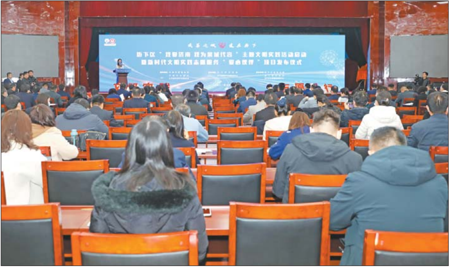
10日上午,历下区举行“我爱济南 我为泉城代言”主题文明实践活动启动暨新时代文明实践志愿服务“爱心伙伴”项目发布仪式。

文明市民是文明城市之本,文明城市更需文明市民代言。在“我爱济南 我为泉城代言”主题文明实践活动中,历下区通过开展“醉美历下”“文明实践 志愿同行”