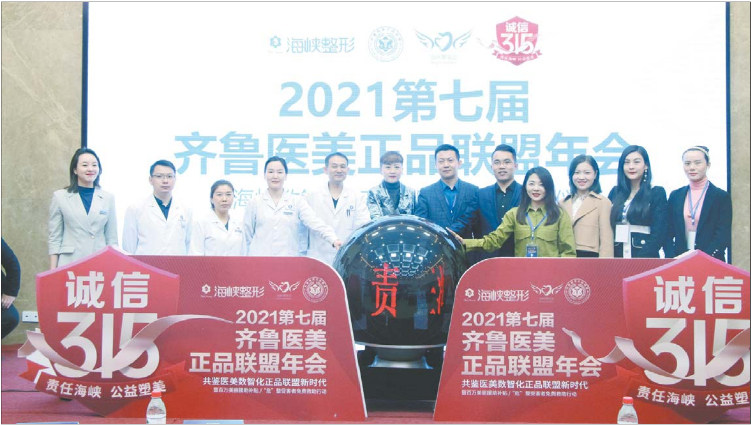
诚信315!海峡、厂家、媒体共启2021第七届齐鲁医美正品联盟年会。