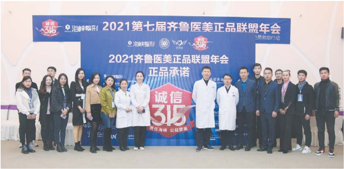
齐鲁医美正品联盟(部分)在“正品承诺墙”前合影留念。