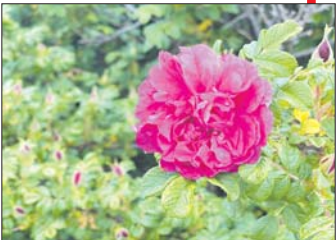
玫瑰给城市注入现代元素,更符合年轻人的审美需求。

4月21日,《小屏话济南》首期节目正式开播,围绕“荷谐玫好”双市花,济南如何打好这张“颜值牌”,嘉宾畅所欲言,就玫瑰增设为济南市市花的意义,以及玫瑰产业、市花经济发展等问题深入探讨。