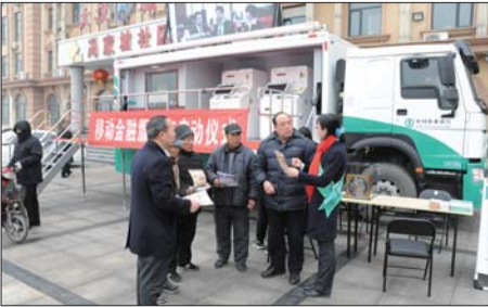
农行莱芜分行举办移动金融服务车启用仪式暨金融服务乡村振兴活动。

实国家政策的必然之举。近年来,农行山东省分行大力推动普惠金融扩面降本。累计选拔金融辅导员600余名,组建金融辅导队186只,发放贷款317亿元,切实提高了小微、民营企业的融资可得性,辅导队考核被评价为“优秀”。 淄博双龙飞塑业股份有限公司是一营生产二销售塑料制品为主的小微企业,产品出口欧洲、美洲、澳洲等地。全面复工复产以来,企业承接了大量塑料制品袋订单,导致原材料需求量激增,流动资金出现困难。获悉企业情况后,农行桓台支行迅速对接企业需求,制定信贷服务方案,第一时间开展上门服务,为其办理“抵押e贷”,一周内就成功放款200万元。有效解除企业后顾之忧。企业负责人说:“农行给我们吃了一颗定心丸,又为我们后续发展未雨绸缪,非常感谢。” 抵押e贷,就是农行山东省分行为满足广大中小企业的多种融资需求,而推出的新型信贷产品。同时,农行山东省分行在“山东农行微银行”上开通小微企业贷款申请窗口,引导客户通过线上渠道办理业务,进一步提升“非接触式”线上服务体验,已累计为20055家小微企业办理纳税e贷、抵押e贷236亿元。 按照监管达标要求,农行山东省分行加快普惠金融贷款投放,提高工作效率。济宁喜嘉利运动制品有限公司是一家专注于运动手套、纺织服装的研发、生产和销售为一体的现代化高科技制造企业。近期,该公司订单大量增加,需批量收购原材料,造成资金短缺,周转困难。农行嘉祥县支行客户经理通过对该公司生产经营、业务、产品进行了解后,上门向其推介了农行“纳税e贷”产品,指导企业通过网上银行申请100万元贷款。“现在有了农行的‘纳税e贷’,只要点点鼠标,在网银上勾选一下,不需要抵押和担保,贷款几秒钟就到账。”济宁喜嘉利运动制品有限公司负责人黄健昌说:“农业银行推出‘纳税e贷’对我们小企业来说是久旱逢甘露,不仅解决了企业的流动资金问题,而且经营成本也降低了。” 2020年末,农行山东分行普惠型小微企业贷款余额396.65亿元,较年初增加177.64亿元,同比多增93.46亿元。做大做强线上信贷产品,农行积极提高客户服务效率,“农银e贷”增加398.8亿元,余额达到649亿元。定期督导,主动落实各项减费让利政策,新发放普惠贷款利率较上年下降47BP。 从助力乡村振兴,到以实际行动支持,参与山东省新旧动能转换,再到落实普惠金融,服务广大中小微企业,农行山东省分行勇扛国有银行重任,服务山东经济社会发展与民生。未来,农行山东省分行将继续认真落实省委省政府部署,全力推进各项工作落到实处,服务山东省经济社会发展大局。