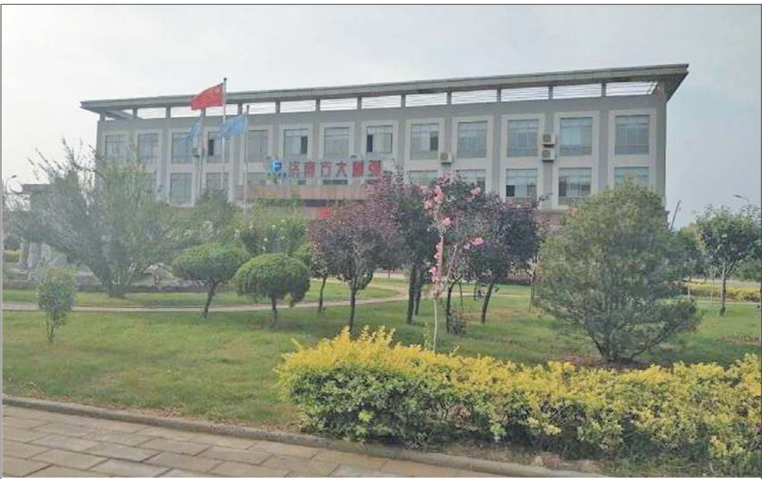
济南方大重弹汽车悬架有限公司严格抓绿化工作,打造花园式工厂。

建设生态森林旅游式工厂、花园式工厂,树立绿色品牌,打造绿色企业……方大集团以“绿色”姿态进入市场以来,坚持以“可持续发展”为己任,积极响应国家环保号召,将环境利益和对环境的管理纳入企业经营管理全过程,并取得骄人的业绩。