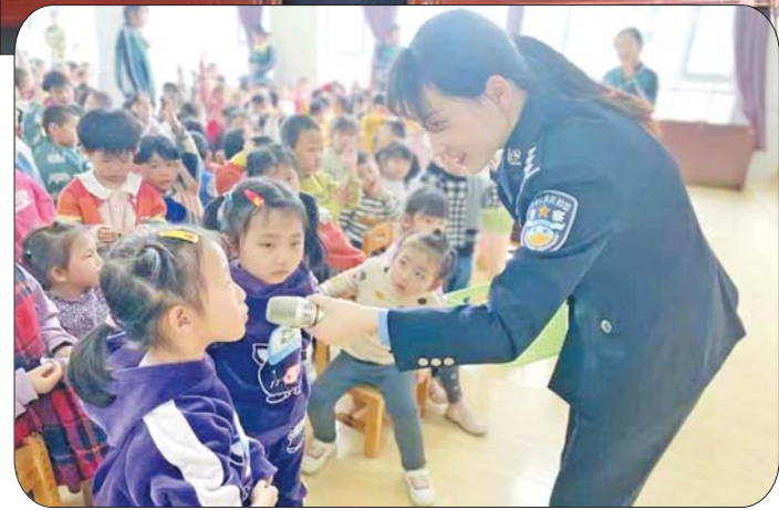
开展“安全知识进校园”系列活动。

与最优的统筹结合,贯彻好教育整顿。分局将教育整顿与建党100周年安保维稳工作紧密结合起来,特别是与争创全省文明单位结合起来。要求全局民警强化争先创优意识,努力提升工作标准,真正把教育整顿的实际成效转化为维护稳定、服务群众的强大动力,做到教育整顿与公安工作“两手抓、两不误、两促进”,为济阳公安“走前列、创一流”提供坚实的思想基础和队伍保障。 以最广的宣传教育弘扬好教育整顿。分局要求开门整顿,坚持以人民为中心,对企业和群众反映强烈的问题和突出执法问题,进行坚决整改、坚决惩治,做到让人民群众参与、受人民群众监督,由人民群众评判。大力宣传公安英模感人事迹,向全社会展现公安队伍的时代楷模、时代正气、时代风采。