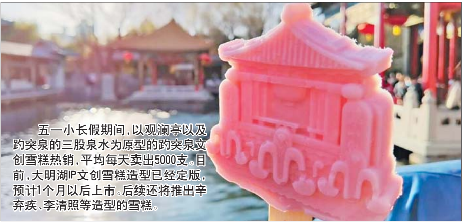
五一小长假期间,以观澜亭以及趵突泉的三股泉水为原型的趵突泉文创雪糕热销,平均每天卖出5000支。目前,大明湖IP文创雪糕造型已经定版,预计1个月以后上市。后续还将推出辛弃疾、李清照等造型的雪糕。