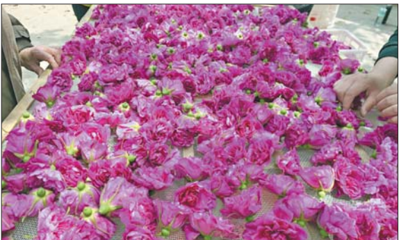
◀玫瑰镇的花农正在整理从花田里采摘来的“花冠”。

第三届中国玫瑰产业博览会暨2021平阴玫瑰文化节即将于5月7日在济南泉城广场举行,这是落户平阴的玫瑰产业博览会首次从平阴县移师济南市中心举行,增选为济南市“市花”的玫瑰将站上更大舞台。