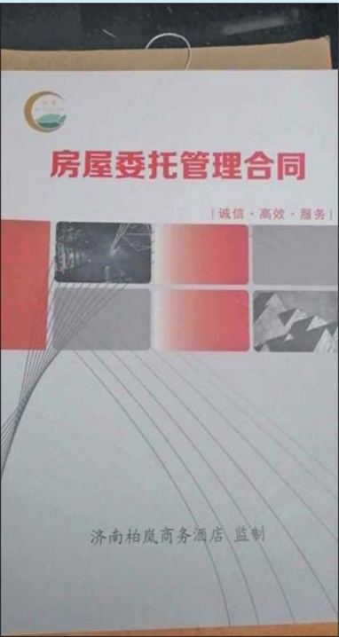
赵芳和托管酒店签的协议。