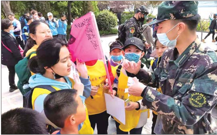
“海丝历险”,孩子们重走海上丝绸之路沿线国家。