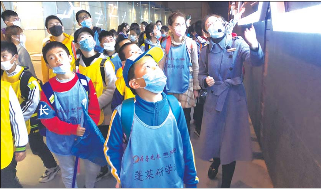
孩子们参观海上丝绸之路博物馆。

本报烟台5月6日讯(记者 秦雪丽 张菁 杜晓丹 钟建军) 乘风破浪,扬帆起航!5月1日,“出发吧,船长!海上丝绸之路历险记”蓬莱精品研学旅行线路开团,来自烟台各个学校的50多名中小学生学习来到人间仙境蓬莱,重走海上丝绸之路,探索古登州的商贾繁华,感受古代东西方文化贸易的碰撞,感悟古人智慧。