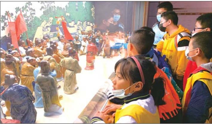
孩子们参观海上丝绸之路博物馆。

和旅游局、齐鲁晚报·齐鲁壹点联合推出发布了“寻觅仙踪”六大精品研学线路,即《出发吧,船长!海上丝路历险记!》与《英雄对话,我是小小戚家军》《乘风破浪!遇见海底奇妙夜》《我是小工匠,擦出非遗与科技的火花》《一颗酿酒葡萄的环球之旅》《寻觅全域蓬莱,点燃红色梦想》,六大研学旅行线路一经推出,受到社会广泛关注。立足丰富的旅游资源和特色文化,与校园课本紧密结合,在推动全面实施素质教育的同时,为全域旅游赋能,蓬莱开启了研学旅行市场新方式。