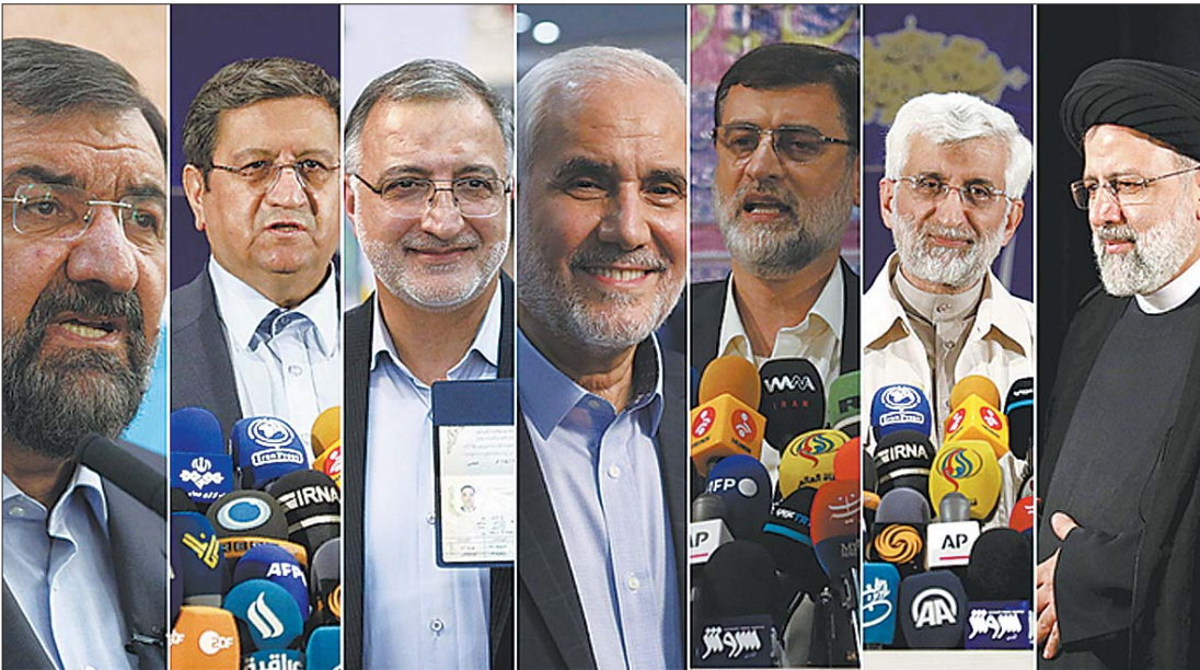
伊朗内政部公布的7名总统候选人，包括伊朗司法总监莱西（右一），伊朗最高国家安全委员会前秘书、前首席核谈判代表贾利利（右二）和伊朗确定国家利益委员会秘书长、伊朗伊斯兰革命卫队前总司令雷扎伊（左一）等人。

伊朗内政部近日宣布，7名总统候选人通过伊朗宪法监护委员会资格审查，可参加将于6月18日举行的总统选举。这7人包括伊朗司法总监莱西，伊朗最高国家安全委员会前秘书、前首席核谈判代表贾利利，伊朗确定国家利益委员会秘书长、伊朗伊斯兰革命卫队前总司令雷扎伊，伊朗议会研究中心负责人扎卡尼，伊朗议会第一副议长哈希米，伊朗前副总统迈赫拉利扎德，伊朗央行行长赫马提。伊朗第一副总统贾汉吉里、前议长拉里贾尼、前总统内贾德等未通过资格审查。这似乎是一场实力悬殊的选举，7人中至少有5人为保守派，温和派代表几乎全军覆没。