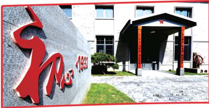
打造“初心·1932”等平台,实现党史学习教育在身边。