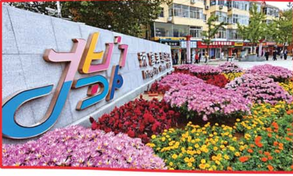
信用“五进”让城市社区大变样。