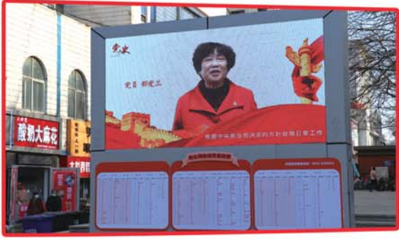
室外大屏幕上播放的“鲸园直播间·百人讲党史”栏目。