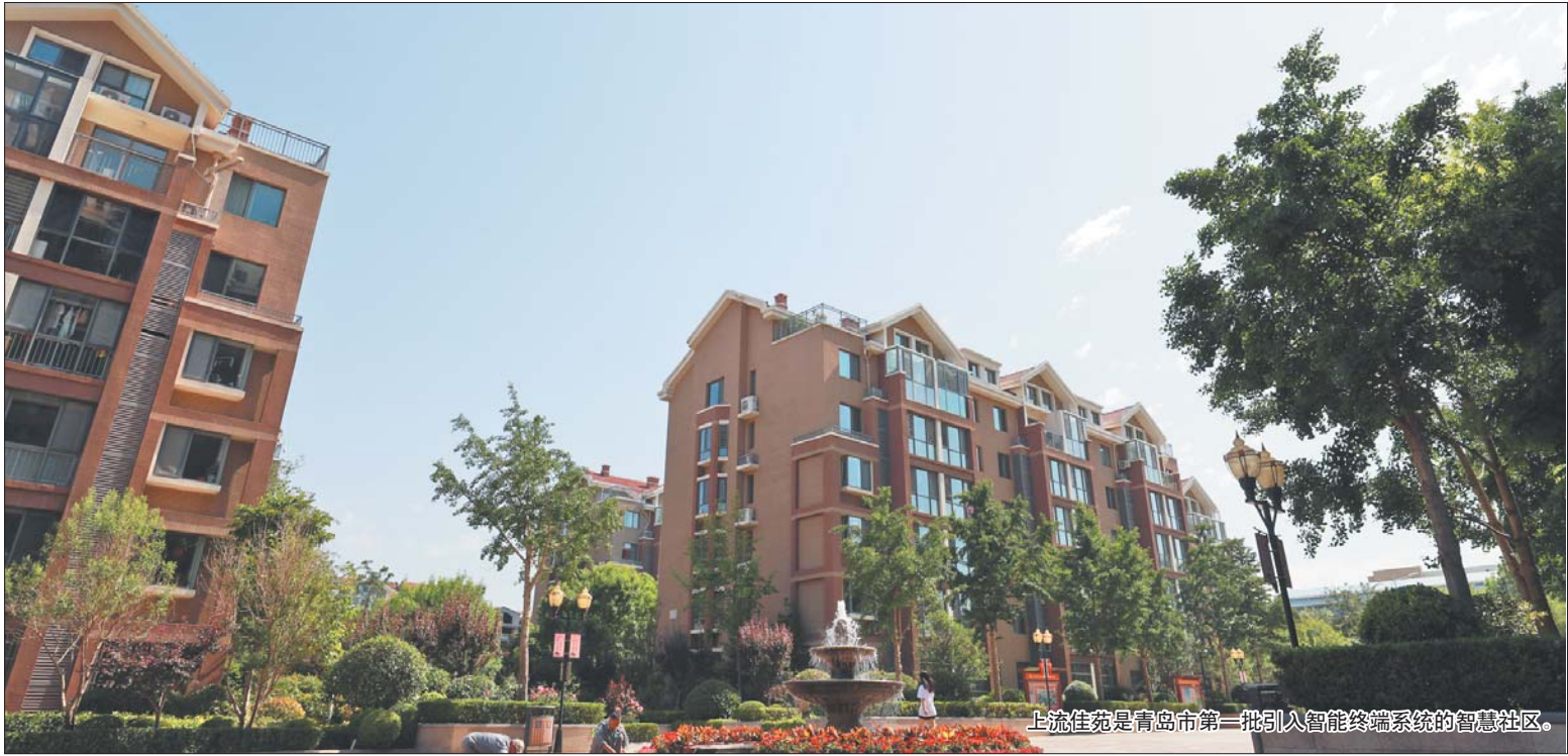
上流佳苑是青岛市第一批引入智能终端系统的智慧社区。