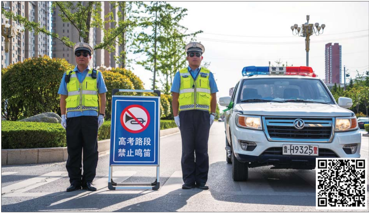
北湖交警临时设置的多块禁止鸣笛的标识牌。

太白湖新区考区第一次承担高考中考组织工作期间全力解决好安全保密、治安环境、交通秩序、照明供电、医疗防疫、考生食宿、网络净化以及防止噪声干扰等问题,形成强大的工作合力,为考生创造公平、和谐、良好的应考环境和氛围,确保考试安全、平稳、顺利进行。