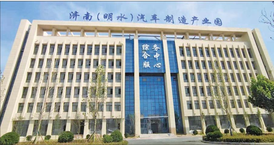
“章丘制造”正声名鹊起