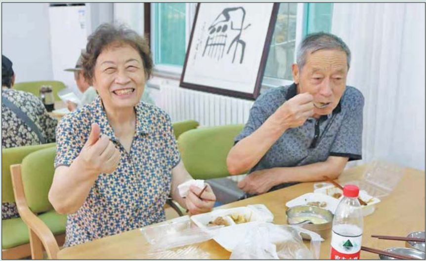
居民点赞科技街社区日间照料中心的“长者食堂”。

今年以来,济南市中区泺源街道持续深化“以人民为中心”的发展理念,以民生需求为导向,全方位打通服务群众的“最后一公里”,让居民居有所安、居有所乐、居有所依,一幅“和合泺源、幸福安居”的民生画卷正徐徐展开。