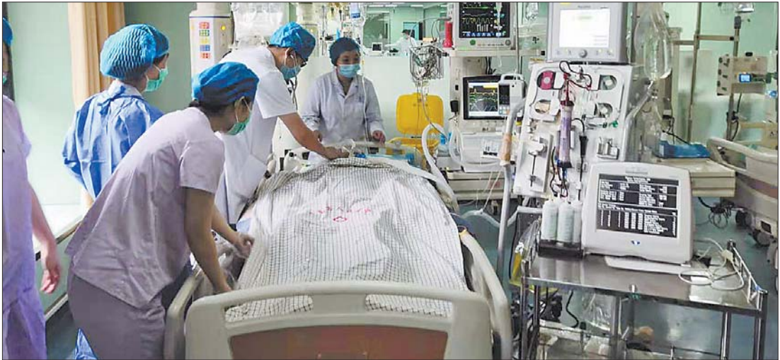
重症医学科采用血液净化技术救治危重病人。

90岁老人因消化道穿孔并严重腹腔感染、感染性休克术后并发多器官功能衰竭,既往有高血压、脑梗塞、糖尿病等基础疾病;76岁老人误食毒蘑菇并发急性肝衰竭、急性肾功能衰竭、弥漫性血管内凝血、感染中毒性休克…… 这是济南市人民医院重症医学科近期成功救治的2例多器官功能衰竭(MOF)的高龄患者。两位老人转危为安的背后是血液净化项目不断拓展和创新。