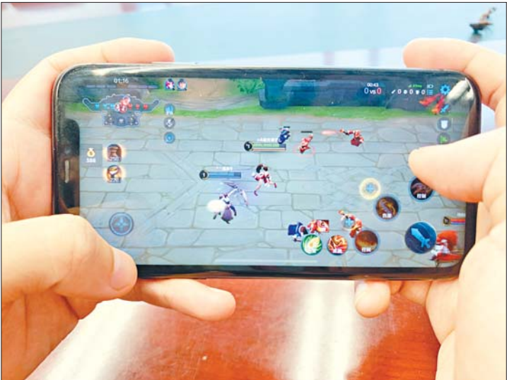
记者用租来的账号顺利登录了游戏。