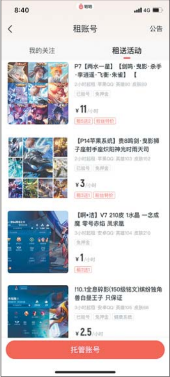
二手游戏账号买卖非常活跃。