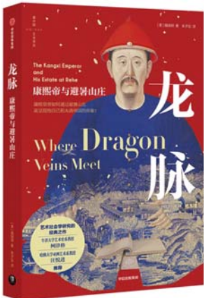
《龙脉:康熙帝与避暑山庄》 [美]魏瑞明 著 朱子仪 译 中信出版集团

所谓“龙脉”是我国古代堪舆学的重要术语,传统堪舆学认为中华大地有三条龙脉,皆发源于昆仑,而泰山的龙