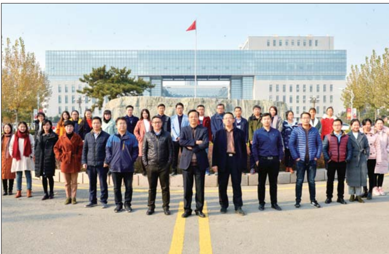
济宁医学院法医学教师团队。