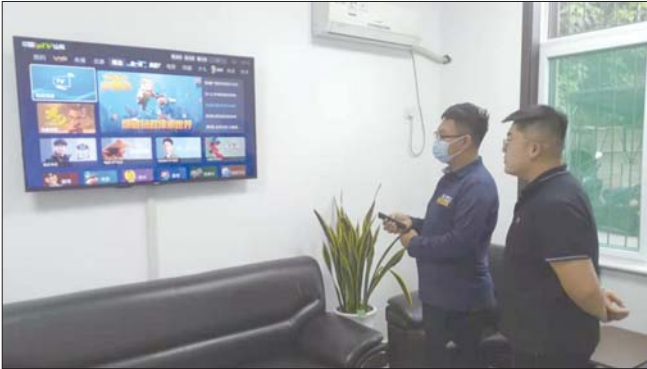
为用户演示魔百盒语音遥控器。

用户了解宽带基础常识,也拉近了与用户的距离,帮助用户解决问题,赢得用户信任。截至目前,济宁移动累计开展“义诊”617场次,覆盖用户20余万。济宁移动将持续坚持新发展理念,充分发挥行业优势,积极履行社会责任,加大惠民力度,聚焦用户感知、了解市场需求,根据用户群体,提供个性化服务,致力于为用户提供更便捷、更优质的服务。真正做到为群众办实事,让用户“10”分满意!