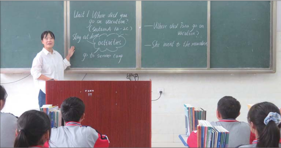
教师在为学生们上课。

一直以来,学校以校本培训为基础,组织各教研组大力开展“新理念、新课堂、新发展”的教研活动、集体备课活动和随堂听课活动,开展课堂教学观摩、典型课例研讨、开放课等活动。充分发挥学科带头人及教学能手的帮扶作用,采用“以点带面、以老带新、以新促老”等途径,加速了教师在思想和业务上的成熟,使教师整体水平得到大幅提高。 教学管理过程中,学校坚持严格执行课程计划、严格教学常