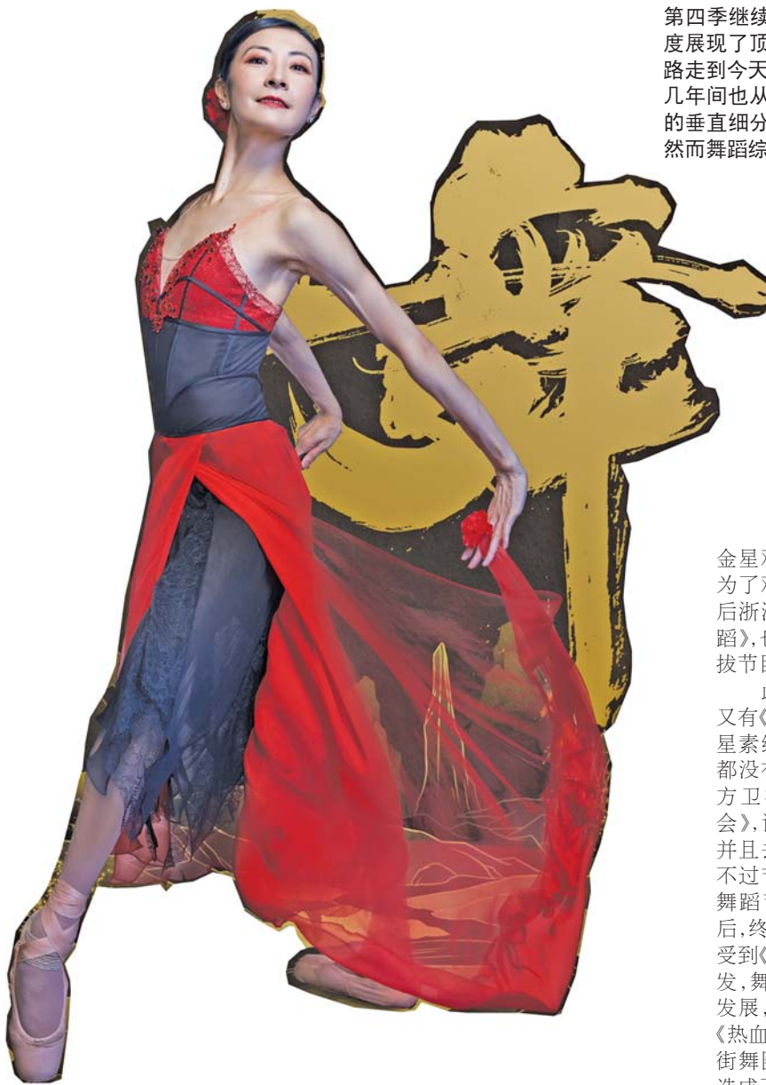
齐鲁晚报·齐鲁壹点 记者 刘雨涵