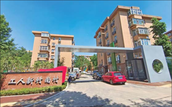
工人新村南村西大门新貌。

在老旧小区改造的过程中,天桥区坚持“应改则改”和“地上一张图、地下一张网”的原则,改造内容不仅囊括了道路整修、绿化提升、消防和照明设施等基础类公共设施改造,各项目还同步抓好雨污分流、弱电管线落地、强电入地等专项改造,同时同步推进节能保温改造、公共空间适老化改造,并因地制宜进行补充绿化、停车或便民设施及智慧化社区管理等完善类和提升类改造施工,让老旧小区改造既重“面子”更重“里子”。