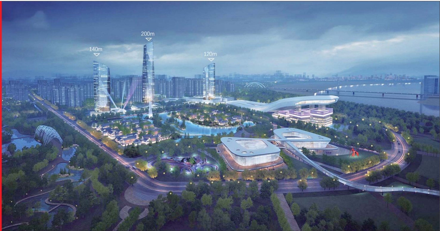
丁太鲁片区效果图。

在改造后,由居民评价改造效果、满意度,同时将居民满意度作为竣工验收的必要条件,并导入“红色物业”系统化治理,搭建“老旧小区智慧化物业管理数据平台”,协商确定小区管理办法和规约,共同维护老旧小区改造成果。