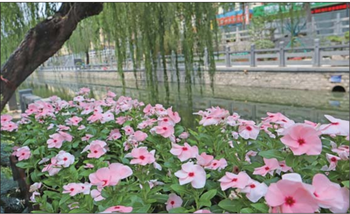
经过改造,百年工商河重焕青春。

此外,天桥区还提高改造标准,突破传统老旧小区改造模式,将老旧小区改造同水、气、电、热、通信等管网改造相结合,一体规划,整体建设,实行全方位立体化改造,力争实现“一次施工、全面提升”。