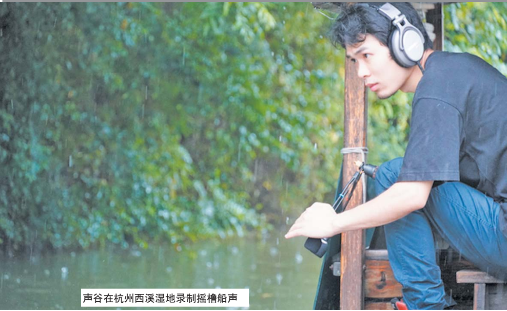
声谷在杭州西溪湿地录制摇橹船声