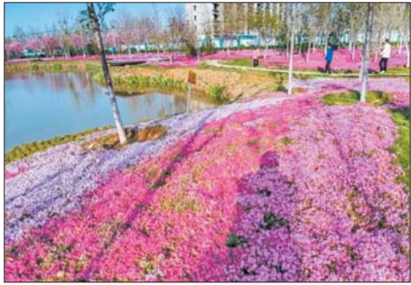
泉城百花园田园综合体。