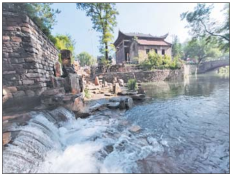
石匣正积极争创国家级旅游示范村。