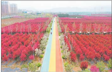
泉城百花园盛开的樱花和海棠花。