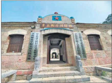
石匣章丘梆子博物馆。