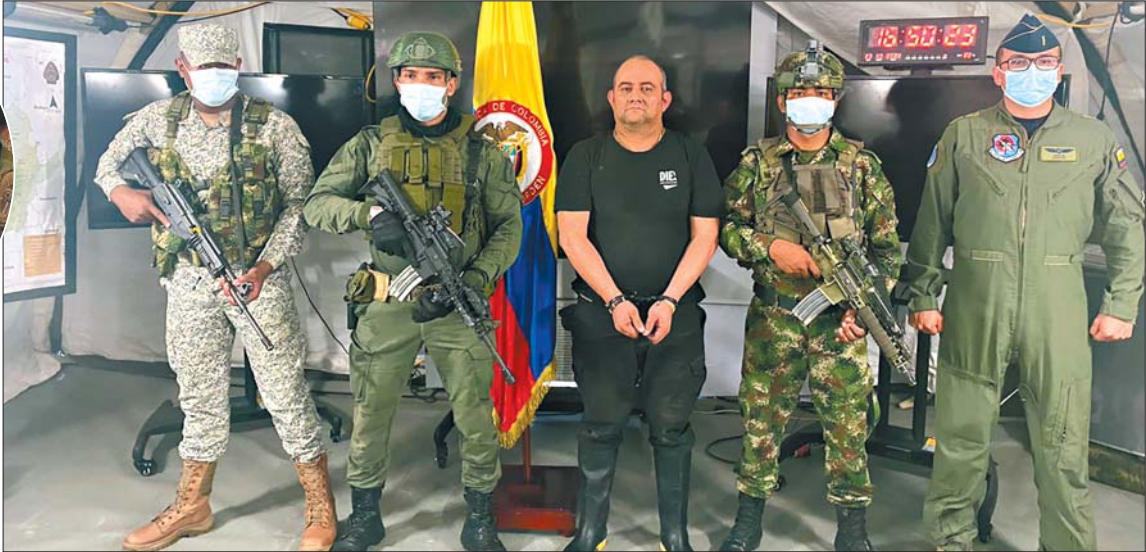
这是23日在哥伦比亚内科克利一处军事基地拍摄的被抓获的哥伦比亚头号通缉毒梟乌苏加(中)。

2012年1月,“乔瓦尼”在哥伦比亚政府的清剿行动中被击毙,乌苏加成了“海湾帮”的最大头目。他有