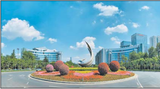
2019年夏的世纪风广场。