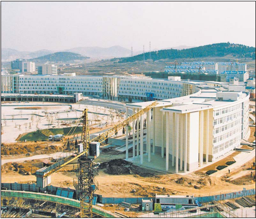
建设中的齐鲁软件园创业广场。