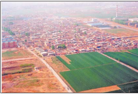
牛旺庄拆迁改造前的航拍。