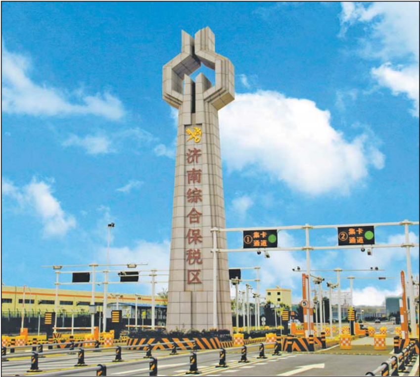
刚通过国家验收的济南综合保税区。