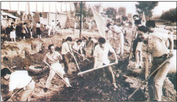
济南高新区成立初期的劳动场面。

30年沧桑巨变,如今,济南高新区已从最初的产业园区变身成为“宜居宜业宜游”的美丽新城区。