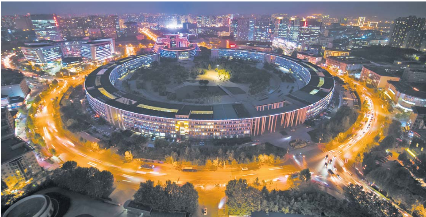
齐鲁软件园创业广场。