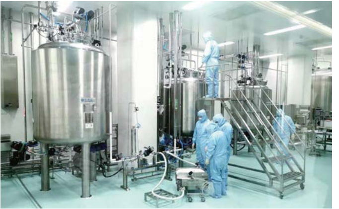
2017年7月,齐鲁制药生物医药产业园投产。

线,确保单抗产能全国第一的目标;“十四五”期间,齐鲁制药平均每年将有20余个新产品获批上市,其中2022-2025年间,齐鲁制药将迎来创新药、生物药爆发式上市。