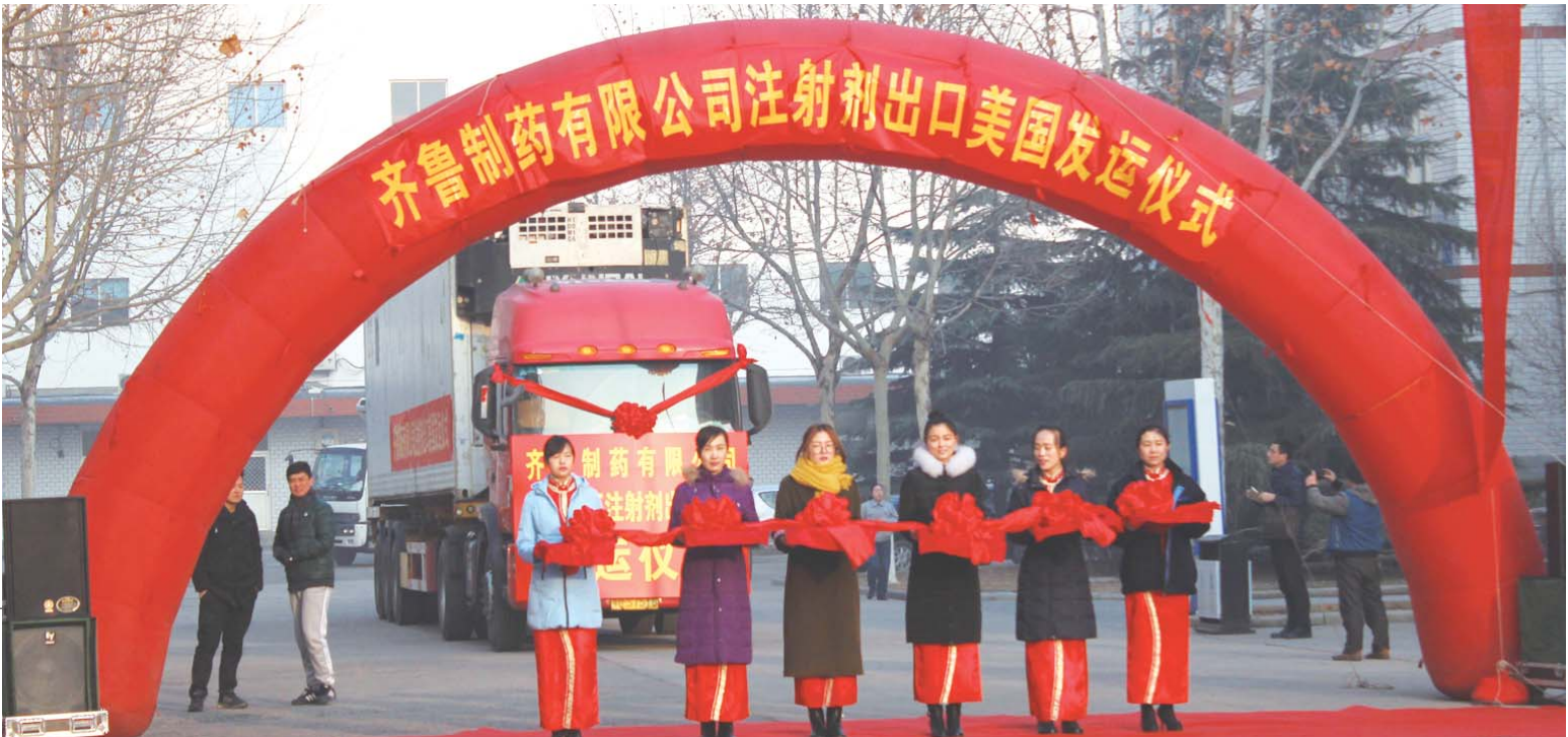
2016年12月28日,齐鲁制药高新厂区生产的头孢类注射粉针剂出口美国。

济南高新区生物医药产业已过千亿规模,作为该产业的龙头企业,齐鲁制药对产业的发展贡献巨大。多年来,齐鲁制药坚持创新驱动战略,根据齐鲁制药的“十四五”规划,“十四五”期间,齐鲁制药平均每年将有20余个新产品获批上市,创新药和生物药将加速上市,把国人的“药瓶子”牢牢攥在自己手里。