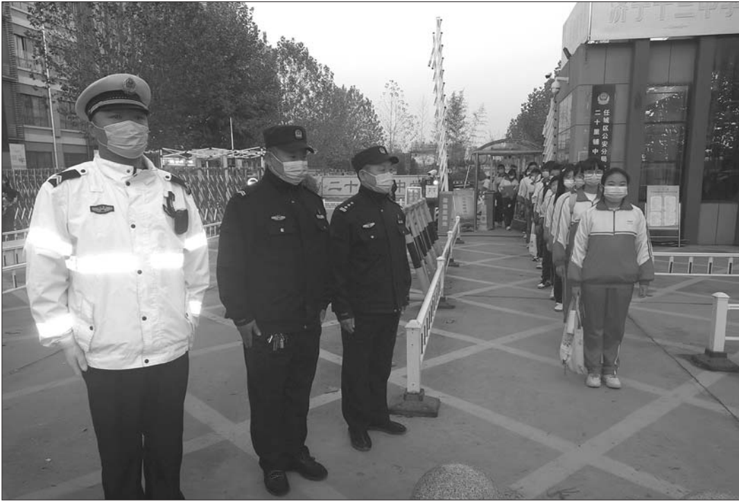
下午放学后,学生们有序离校。

本报济宁11月15日讯(记者 姬生辉) 11月11日下午5点,任城区二十里铺中学的校园内响起了悠扬的放学铃声。班主任老师们组织学生排队,并有序带领学生到达校外接送岗;派出所民警认真在校门口执勤,保障安全秩序;交警在保安队员和家长志愿者的辅助下,指挥路面交通,引导学生们安全经过斑马线……短短20分钟,1400余名学生有序离校。自2018年初,任城区二十里铺中学在公安、交警、综合执法等部门和家长的大力帮助下建立起了护学岗,为孩子们撑起了上下学路上“安全伞”。 “学校位于任城区南延路,学生早晚进出学校的时间点恰逢上下班高峰期,车流量比较大。”任城区二十里铺中