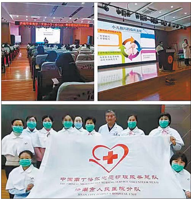
济南市人民医院举办的系列科普活动。

“我对某某病不太了解,需要从哪方面预防?”“我获得的这些预防保健知识是专业的吗?”在义诊过程中,不少市民都有这样那样的疑问。一方面群众对慢性病危害性认识不足,对于预防疾病、紧急救治、合理用药等知识技能了解较少,又常被形形色色的伪健康知识所误导,为此,济南市人民医院大力开展居民健康素养提升、将医疗服务范围由“治病”向“防病”延伸。